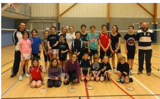
Hiver (12 & 13 février 2015) : 21 stagiaires

Encadrés par le Comité Départemental de Badminton d'Ille-et-Vilaine, l'Office des Sports Maure-Pipriac et les bénévoles du MBC.