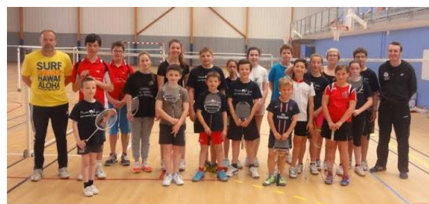
Pâques (23 & 24 avril 2015) : 19 stagiaires