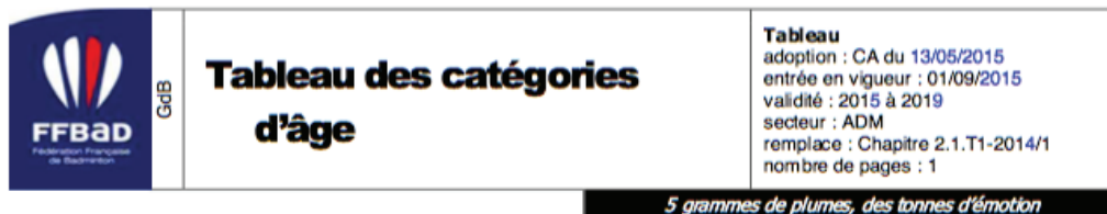
TABLEAU DES CATEGORIES D'AGE